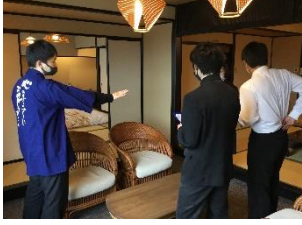
花のおもてなし南楽