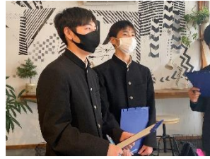
ローカル×ローカル

「はたらく」ということや「地域の中で生きていく」ということについて考えを深める機会になったと思います。職場見学を受け入れて下さった各事業所の皆様、ありがとうございました。